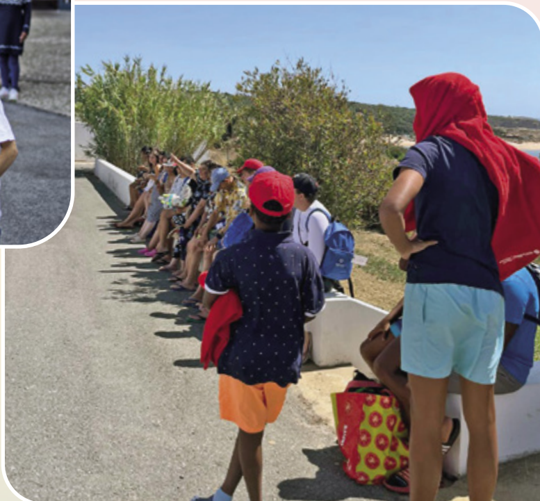
Rapazes da Casa São Francisco de Assis (antiga Casa do Gaiato de Lisboa), num campo de férias em Vila Nova de Milfontes

Agradecimentos: A CDL agradece profundamente a todos os seus benfeitores e voluntários. Seu apoio contínuo é fundamental para que possamos continuar a nossa missão. Cada contribuição, grande ou pequena, é um passo em direção a um mundo mais justo e solidário.