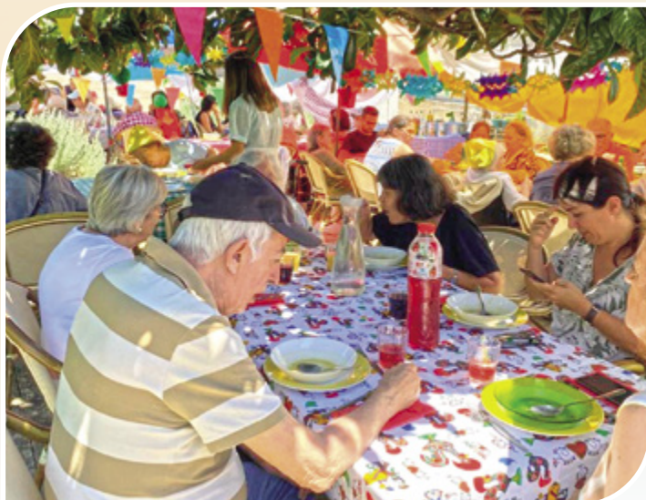
Arraial do Lar da Bafureira