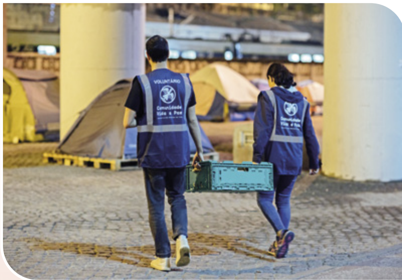
Distribuição de alimentos às pessoas em situação de sem abrigo

Os nossos esforços são um reflexo do amor de Cristo em ação. Citando o Papa Francisco: A verdadeira caridade exige coragem: coragem para ir contra a corrente, para não ceder à tentação de "lavar as mãos" e ficar de fora. A generosidade dos nossos benfeitores tem sido fundamental para fazer da Igreja uma verdadeira rede de relações fraternas. Nos últimos cinco anos, a CDL recebeu 1.314 milhão € em donativos, provenientes de benfeitores individuais ou empresas. Com o vosso apoio, continuaremos a transformar vidas e a construir uma sociedade mais justa e solidária.