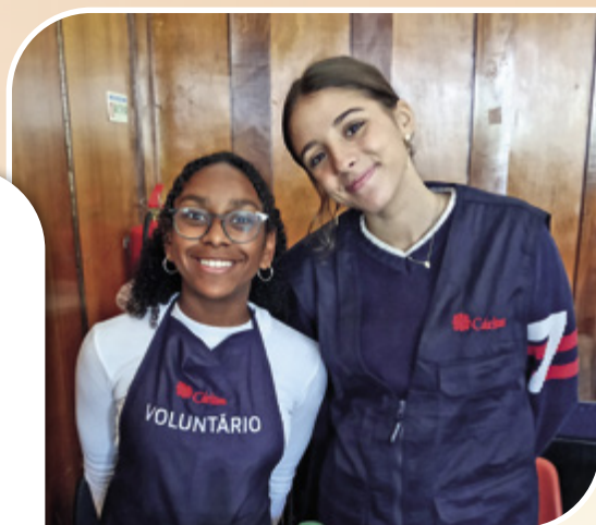
Jovens voluntários, no Dia Mundial dos Pobres (Paróquia da Damaia)