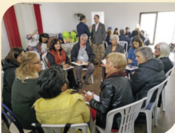
Celebração do Dia Internacional da Caridade, em Coz, Alcobaca. Trabalho de grupo