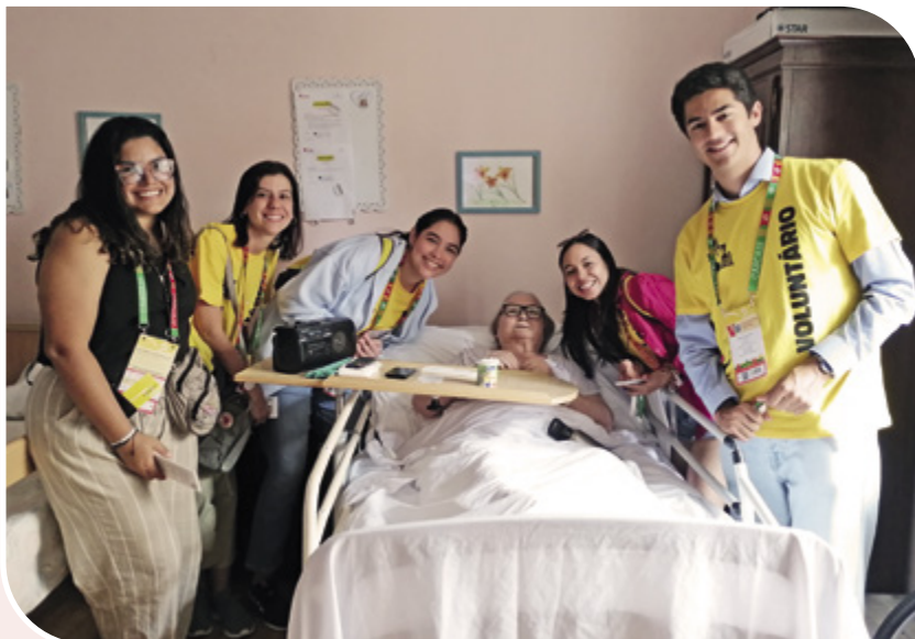
Gesto Missionário de jovens JMJ, no Lar da Bafureira

Este foi um ano em que apostámos no convívio dos residentes entre si e com os familiares, voluntários e amigos da Casa. Foram 22 os momentos de partilha e de convívio ao longo de todo o ano, mas o momento mais marcante, o que os residentes guardam com grande saudade, foi o Gesto Missionário da Jornada Mundial da Juventude Lisboa 2023. Uma pulseira, com o nome de cada residente, seria levada ao Papa Francisco por voluntários da Jornada, que vieram ao nosso encontro e nos proporcionaram um momento de convívio, de partilha, de música, de oração e de muitas conversas. A vinda do Papa Francisco a Portugal foi acompanhada de perto, por todos os residentes, que com entusiasmo, iam partilhando pareceres, oração e muita alegria.