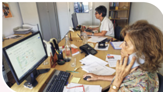
Gabinete de Ação Social CDL

A atividade do Gabinete de Ação Social no ano de 2023 destaca-se em duas vertentes: a Ação Social, que visa o atendimento social e o trabalho direto com as Paróquias, nomeadamente com os grupos paroquiais de ação social, onde se inserem as formações, visitas a paróquias, participação/promoção de Encontros de Cáritas Paroquiais e o Projeto Recuperar +Famílias.