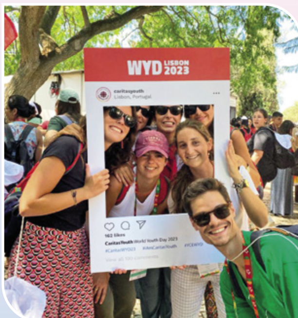
Cidade da Alegria, tenda da Cáritas Jovem, em Belém, Lisboa (JMJ)