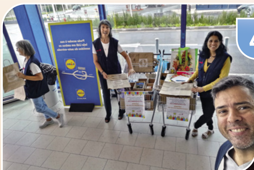
Recolha de material escolar numa loja LIDL