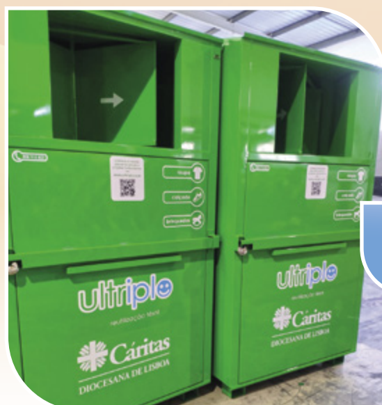
Contentor de recolha de roupa usada da Ultriplo