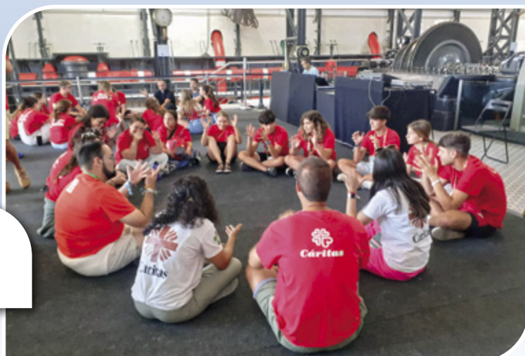
Meet Up da Caritas Internationalis, Museu da Eletricidade, Belém, Lisboa (JMJ)