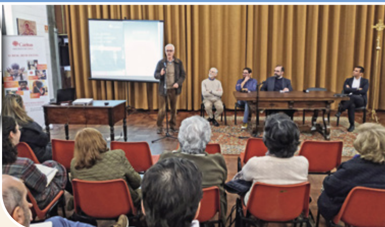
Semana Nacional Cáritas: Encontro sobre a Ação Social na Vigararia V de Lisboa