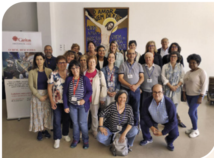
Encontro das Cáritas Paroquiais, na Casa do Oeste, em Ribamar, Lourinhã

Assim se compreende a importância do fomento da Rede Cáritas, garantindo que "os lugares onde a Igreja se manifesta, particularmente as nossas paróquias e as nossas comunidades, se tornem ilhas de misericórdia no meio do mar da indiferença!" (Papa Francisco). De um conjunto de 33, neste relatório apresentamos o contributo de 25 Cáritas Paroquiais, mais 10 do que em 2022.