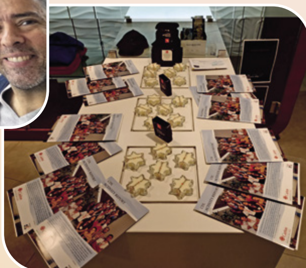
Venda de velas no Holmes Place, Lisboa