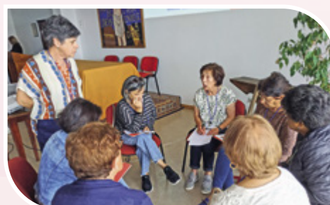
Assistente Social CDL modera grupo de trabalho no Encontro do Oeste das Cáritas Paroquiais