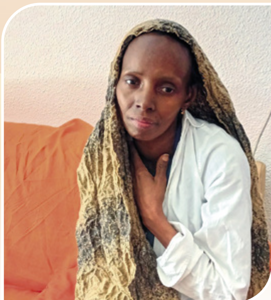
ULAI, doente da Guiné

Apesar de um resultado deficitário de 412.925,05€ no exercício de 2023, a CDL recebeu um total de 241.057,70€ por parte de diversos parceiros e benfeitores. A Igreja também contribuiu significativamente, doando 100.000€. Estes recursos foram essenciais para manter as operações e fornecer ajuda direta aos mais vulneráveis. O montante global dos donativos concedidos atingiu os 249.867,16€, para além da cessão gratuita de espaços para projetos sociais, que representou um valor adicional de 81.953,64€.