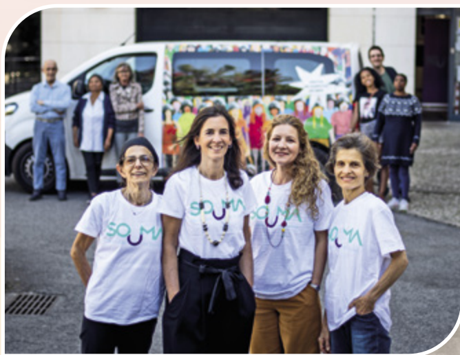
Preparação semanal de cabazes de alimentos pela equipa SOUMA para distribuição a 483 pessoas

Donativos em Espécie: Concedemos 83.079,52€ através da cedência de espaços (81.953,64€) para atividades de valor social, como a Creche do Centro Paroquial de Carnide, a Fundação Famílias comVida, a Comunidade Vida e Paz e a associação SOUMA. Outros donativos em espécie, num valor de 1.125,88€, foram recebidos maioritariamente em produtos de higiene.