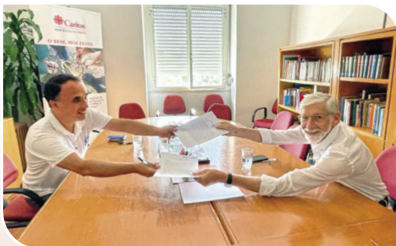
CDL celebra acordo de cooperação com o CEPAC no apoio aos migrantes

A participação em redes temáticas, sobretudo ao nível das migrações, tem permitido também que a CDL contribua com o conhecimento adquirido ao longo dos anos com a sua intervenção no terreno.